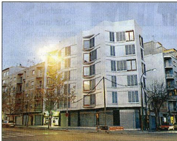
El inmueble de Toni Forteza.

El trabajo se convirtió, con el tiempo y los descubrimientos que se iban sucediendo, en «recuperar el valor patrimonial» del casal. «Encontramos dos pilares góticos dentro de dos neogóticos y un horno de barro musulmán que se inventarió». Se hizo inci-